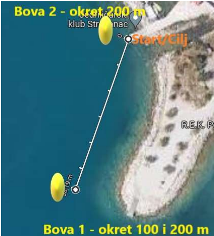
Skica staze za dječje i žensku utrku